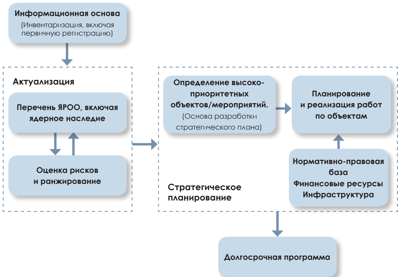
Рис. 1. Система планирования работ в области ядерного наследия

Первые два этапа по планированию работ в области обеспечения ядерной и радиационной безопасности в отношении объектов ядерного наследия (рис. 1) были реализованы в рамках отдельных мероприятий ФЦП ЯРБ. Для оценки эффективности этой деятельности был предусмотрен специальный целевой показатель «Проведение инвентаризации ядерно- и радиационно опасных объектов» с конечным значением 270 штук. Начиная с 2008 г., показатель инвентаризации ядерно- и радиационно опасных объектов (ЯРОО) входит в обязательную государственную отчетность по форме № 1-ФП (индикаторы), утвержденную приказом Росстата № 195 от 18.08.2008 [5].